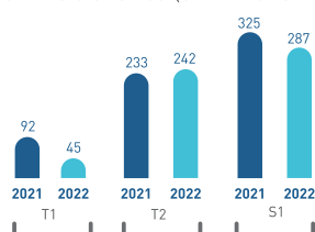
Chiffre d'affaires (en millions DH)

La quasi-totalité du chiffre d'affaires du premier semestre provient des biens développés par Résidences Dar Saada S.A.