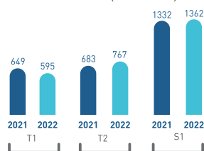
Préventes (en unités)

Grâce à une bonne dynamique des projets et à une politique commerciale ciblée, le niveau des préventes au titre du deuxième trimestre 2022 s'élevé à 767 unités contre 683 unités sur la même période de l'exercice 2021, soit une progression de 12%. Ainsi le total des préventes réalisées au titre du premier semestre 2022 atteint 1362 unités contre 1332 unités au titre de la même période 2021.